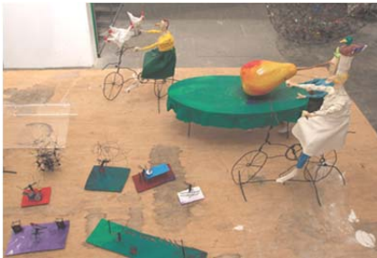
Ansichten aus dem Atelier