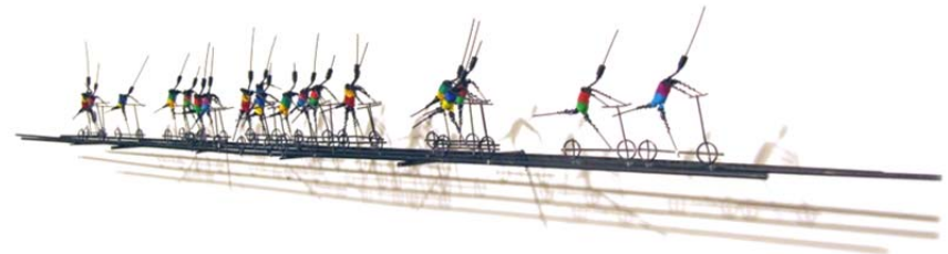
Früh-Rentner, 2011 Draht, Ton 12 x 80 x 10 cm

Wer sich eingehend damit einlässt, realisiert, wie doppelzünftig und geradezu subversiv diese Ereignisse sein können und wie viel menschi- liche Tragik in ihnen zum Ausdruck kommt.