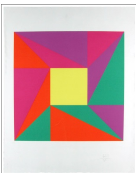
Komposition – gelbes Quadrat eingemittet, 1990 Farbserigrafie 64 x 50 cm

Interessante Website: www.bill-stiftung.ch/maxbill.htm