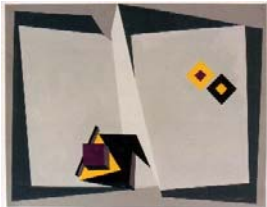
Espace concertés, 1969 Acryl auf Papier 39 x 50 cm

Ab 1950 verfestigte sich sein Stil in einem abstrakt-expressiven Spachtelauftrag zu einer eigenständigen Malerei. Eine geometrische Figurensprache in den Hauptfarben rot und blau wird von da an prägend in seinem Werk. In seinem Spätwerk, etwa ab 1976 zeigt sich eine Rückwendung zur surrealen Malerei, was er selbst als Synthese lebenslangen Schaffens sah.