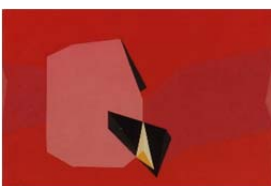
Espace concertés, 1969 Acryl auf Papier 42,5 x 64,5 cm

1937 fand seine erste Ausstellung in Rouen (F) statt. Seine anfänglichen Arbeiten begründeten sich durch Bekanntschaften mit Max Ernst, Pablo Picasso und Francis Picabia und der Beschäftigung mit den Arbeiten von Salvador Dalí auf einem surrealistischen Malstil.