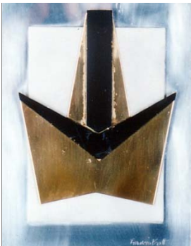
Metall-Collage, 1970 35 x 25 cm

Während des 2. Weltkrieges war er in der Résistance aktiv, lebte als Holzfäller in Carcassonne und kehrte 1945 nach Paris zurück. In den folgenden Jahren stellte er erfolgreich in Frankreich, Belgien und den Niederlanden aus, wurde aber erst Ende der 1940er Jahre in Deutschland als Maler zur Kenntnis genommen.