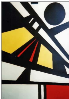
L'acier, 1969 Farblithografie 67 x 48,5 cm

Mit einem selbstgebauten Zirkus voller Drahtakrobaten gab er – zunächst nur für Freunde – Vorstellungen in Paris, bei denen er seinem Spieltrieb freien Lauf liess und Geschichten und Tiergeräusche zum Besten gab. Lobende Besprechungen über Calders «Zirkus» erregten das Interesse von Kunstgrössen wie Léger, Duchamps und Miró. Das wachsende Interesse an seinen Objekten bewegte den Maler Calder zu einer vertieften Auseinandersetzung mit der Plastik.