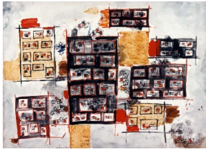
La Fête, 1970er Jahre Gouache auf Papier 55 x 75 cm

Geboren 20.12.1915, Bukarest (R) Nationalität Rumänien, Frankreich Gestorben 3. 7.1997, Paris Tätigkeitsgebiet Malerei, Grafik